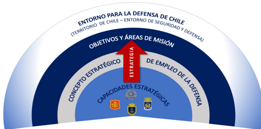
Ilustración 3.- Estrategia de Defensa (Ministerio de Defensa Nacional, 2020, pág. 51)

objetivos de seguridad externa y objetivos de seguridad interna y desarrollo (Ministerio de Defensa Nacional, 2020, pág. 51).