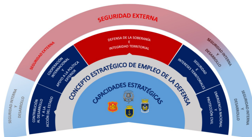
Ilustración 4.- Concepto estratégico por áreas de misión (Ministerio de Defensa Nacional, 2020, pág. 58).

Como se ha señalado de manera previa, de los objetivos de Defensa se desprenden las Áreas de Misión, las que corresponden a la “Defensa de la soberanía e integridad territorial”, la “Cooperación Internacional y apoyo a la política exterior”, la “Seguridad e intereses Territoriales”, la “Emergencia nacional y protección civil” y finalmente la “Contribución al desarrollo nacional y la acción del Estado”. Estas áreas de misión se encuentran establecidas con el propósito de poder determinar las capacidades estratégicas que la Defensa requiere para hacer frente a los fines de la defensa y así enfrentar los riesgos y amenazas.