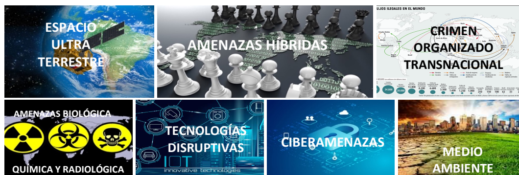
Ilustración 2.- Conflictos y Amenazas a nivel Global (Elaboración propia).

Dentro de dichas amenazas se encuentran las de naturaleza híbrida, las que comprenden “actividades hostiles de origen interno o externo que combinan métodos y capacidades convencionales y no convencionales (campañas de desinformación, ciberataques, terrorismo, sabotaje, insurgencia, etc.), coordinadas o ejecutadas tanto por agentes estatales como otros grupos u organizaciones no estatales” (Ministerio de Defensa Nacional, 2020, pág. 43).