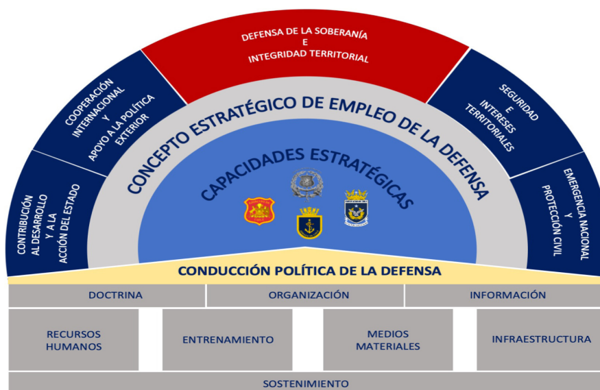
Ilustración 5.- Capacidades Estratégicas (Ministerio de Defensa Nacional, 2020, pág. 80)

La Política de Defensa ha clasificado las Capacidades Estratégicas en Áreas Generales de Capacidades Estratégicas, para de este modo agruparlas y generar un ordenamiento de las habilidades que deben contar las fuerzas para poder desempeñarse en el cumplimiento de sus objetivos en las diferentes áreas de misión. La Política de Defensa ha definido siete áreas generales de capacidades estratégicas de la Defensa, las que comprenden la Seguridad Operacional; Protección; Inteligencia, vigilancia y reconocimiento (ISR); Mando y Control Integrado; Movilidad y Proyección; Sostenibilidad y Despliegue Territorial.