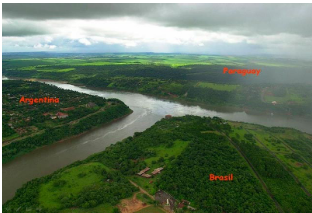
Figura 2: La “Triple Frontera”