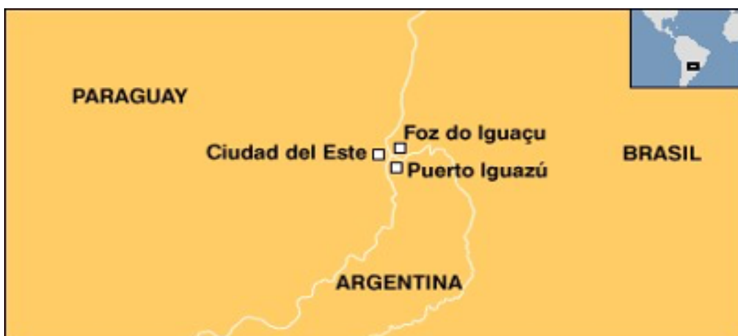
Figura 1: Mapa de la Triple Frontera

Finalmente, más alejada y menos próspera, aparece Puerto Iguazú, ciudad centrada en el turismo y que tiene como principal atractivo el parque nacional donde se encuentran las Cataratas del Iguazú.